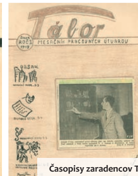
Časopisy zaradcov TNP

Príprava zákona o táboroch nútenej práce (TNP) začala v polovici roku 1948 a vychádzala zo skúseností s fungovaním pracovných útvarov zriadených na Slovensku v marci 1948. Minister spravodlivosti Alexej Čepička videl v pripravovanom zákone možnosť izolovať režimu nepohodlné osoby, ktoré sa nedopustili trestného činu. Časť členov Ústredného výboru Komunistickej strany Československa (KSČ), napr. predseda Národného zhromaždenia Oldřich John, si uvedomovala protiústavnosť návrhu – obmedzenie slobody za správanie, nie za trestný čin . Tvorcovia zákona neskrývali snahu „urobiť z neho v rukách robotníckej triedy nástroj zosťreného triedneho boja...“, pričom počítali s internáciou viac ako 30 000 osôb.