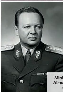
Minister národnej obrany Alexej Čepička. Podieľal sa na zriadení TNP