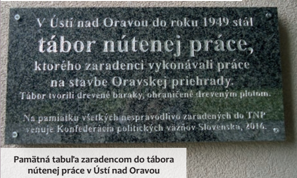
Pamätná tabuľa zaradencom do tábora nútennej práce v Ústí nad Oravou

„Myšlienka zriadiť v Československu TNP vznikla minulý rok po [sokolskom] zlete. Vtedy sa ukázalo, že reakcia a zvyšky kapitalistickej triedy v Československu sa spamätávajú zo zdrvivého úderu, ktorý im bol zasadený februárovými udalosťami roku 1948 a že sa pokúšajú o znovuzískanie stratených pozícií alebo aspoň o poškodzovanie socialistickej výstavby.“