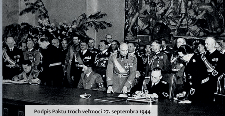
Podpis Paktu troch veľmocí 27. septembra 1944