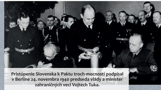
Pristúpenie Slovenska k Paktu troch mocností podpísal v Berlíne 24. novembra 1940 predseda vlády a minister zahraničných vecí Vojtech Tuka.