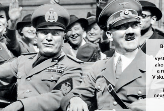
Benito Mussolini a Adolf Hitler vystupovali navonok ako najlepší spojenci a nezištní priatelia. V skutočnosti však boli ich vzťahy poznamenané neustálym súperením a vzájomnou nedôverou.