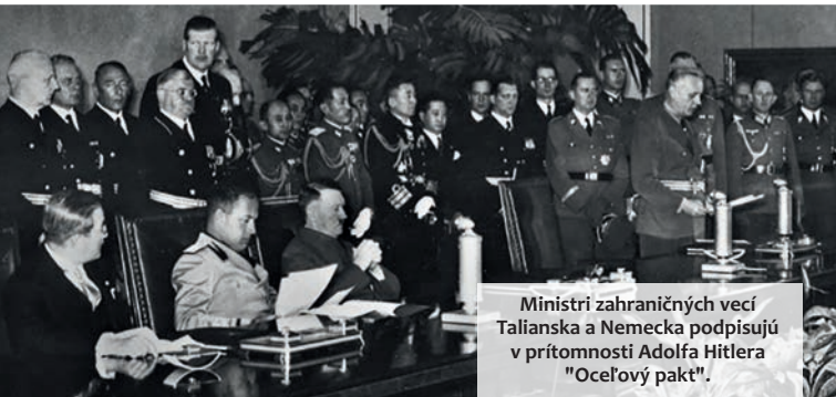
Ministri zahraničných vecí Talianska a Nemecka podpisujú v prítomnosti Adolfa Hitlera "Oceľový pakt".