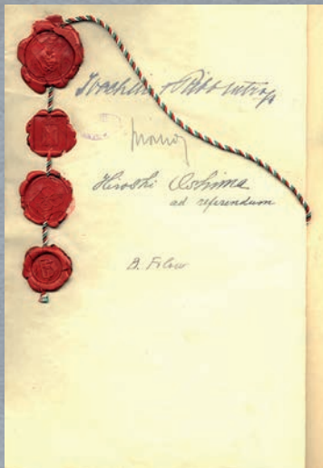
Protokol o pristúpení Bulharska k Paktu troch mocností.