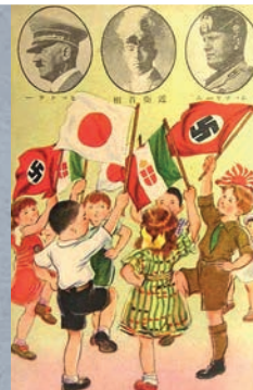
"Dobří priatelia v troch krajinách." Propagandistická pohľadnica z roku 1938, ktorá zobrazuje japonského premiéra Fumimaro Konoeho spoločne s Adolfom Hitlerom a Benitom Mussolinim.