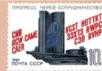
Sovietska poštová známka vydaná pri príležitosti 40. výročia vzniku RVHP