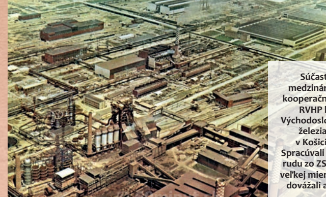
Súčasťou medzinárodnej kooperačnej siete RVHP boli Východoslovenské železiarne v Košiciach. Spracúvali železnú rudu zo ZSSR a vo veľkej miere odtiaľ dovážali aj uhlie