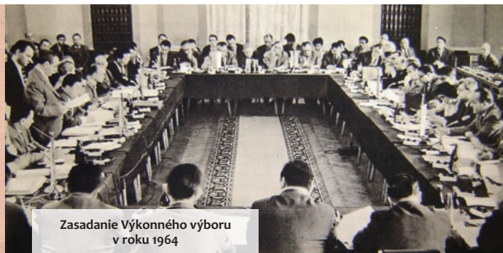
Zasadanie Výkonného výboru v roku 1964