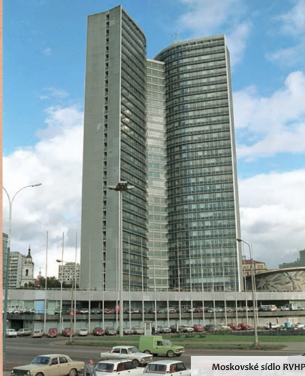
Moskovské sídlo RVHP

„Pre hospodárstvo Československej republiky, ktoré sa do roku 1948 orientovalo prevažne na trhy vyspelých západných krajín, vznikla katastrofálna situácia, keď sa doslova zo dňa na deň muselo preorientovať na trhy členských štátov RVHP. Znamenalo to izoláciu od priemyselne vyspelých krajín, stratu tradičných trhov na Západe, obmedzenie a prechodné i vylúčenie možností nákupu moderných technológií a pod.“