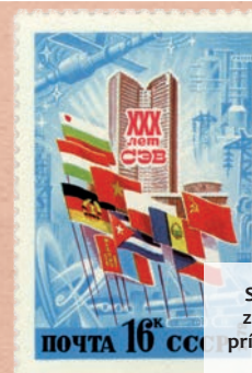
Sovietska poštová známka vydaná pri príležitosti 30. výročia vzniku RVHP