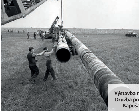
Výstavba ropovodu Družba pri Veľkých Kapušanoch