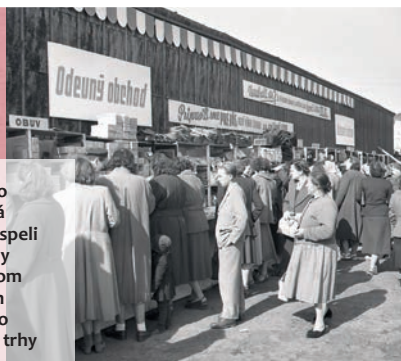
Zrušenie lístkového systému a peňažná reforma podstatne prispeli k rozšíreniu výmeny tovarov medzi mestom a dedinou. Jedným z prostriedkov tejto výmeny boli i roľnícke trhy