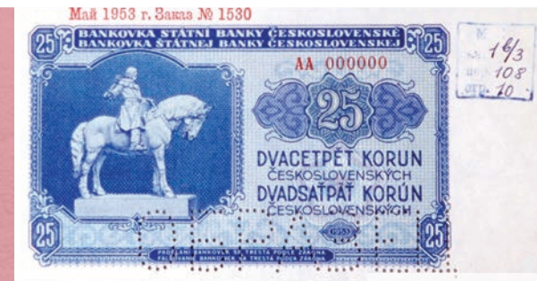
Vzor s dátumom tlače v máji 1953

Menová reforma z októbra 1945 obeživo zredukovala viazaním všetkých vkladov a núteným zložením hotovostí na ne. Peniaze z nich nebolo možné vyberať. Autori reformy očakávali, že spôsobené dlžoby a škody Nemecko uhradí reparáciami. Tie mali umožniť ozdraviť menu a naraz uvoľniť viazané vklady. Ľuďom sa sľubovalo, že nič nestratia. Toto očakávanie bolo morálne oprávnené, ale nereálne. Pod tlakom medzinárodnej situácie v r. 1947 vznikol návrh zrušiť prevažnú časť viazaných vkladov. Ako sociálne neprijateľné to kvôli udržaniu voličov odmietla KSČ. V r. 1947 vznikol Likvidačný fond menový s nespiteľnou úlohou – hľadať prostriedky na krytie meny. Studená vojna zmarila nádej na reparácie zo západného Nemecka. Nebolo ich možné získať ani z východného Nemecka. Bolo hospodársky slabé a reparácie tam čerpal ZSSR, ktorý nebol ochotný sa o ne deliť. Čiastočným uvoľňovaním viazaných vkladov, najmä zo sociálnych dôvodov, sa zadržané, vojnou znehodnotené peniaze vracali do obehu. Po februári 1948 menu zaťažovalo budovanie ťažkého priemyslu, veľkých stavieb s dlhou návratnosťou a vysoké náklady na obranu.