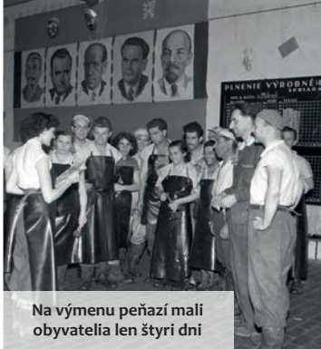
Na výmenu peňazí mali obyvatelia len štyri dni