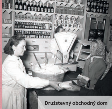
Družstevný obchodný dom