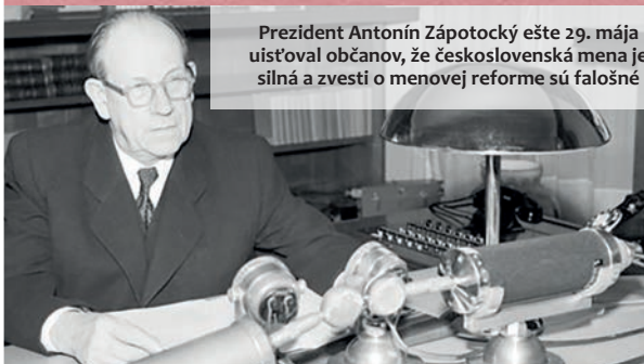
Prezident Antonín Zápotocký ešte 29. mája uistoval občanov, že československá mena je silná a zvesti o menovej reforme sú falošné