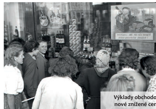
Výklady obchodov lákali na nové znížené ceny tovarov