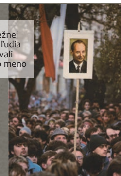
Počas Nežnej revolúcie ľudia skandovali Dubčekovo meno