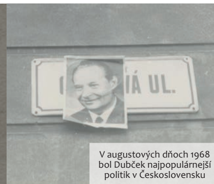
V augustových dňoch 1968 bol Dubček najpopulárnejší politik v Československu