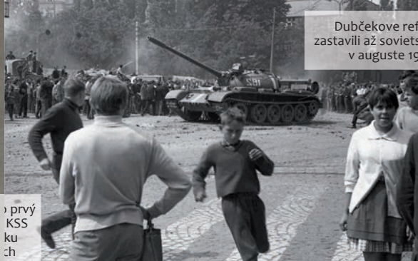
Dubčekove reformy zastavili až sovietske tanky v auguste 1968