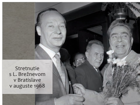
Stretnutie s L. Brežnevom v Bratislave v auguste 1968