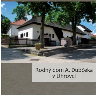
Rodný dom A. Dubčeka v Uhrovci