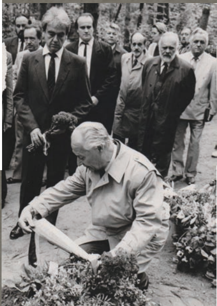
V 90. rokoch bol predsedom Federálneho zhromaždenia