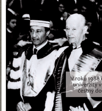
V roku 1988 dostal od univerzity v Bologni čestný doktorát