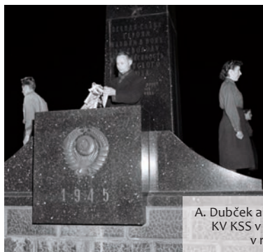
A. Dubček ako vedúci tajomník KV KSS v Banskej Bystrici v roku 1953