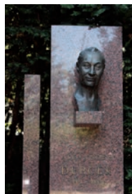
Pomník A. Dubčeka na cintoríne v Slávičom údolí

„Alexander Dubček dozaista nebol politický génius. Ani sa za takého nikdy nevydával, nikdy nepovažoval. Bol to však nepochybne čestný a statočný človek a politik. A to nie je málo. Politik, ktorý nechcel a nevedel byť cynik ani číry politikár. Niet sporu o tom, že pre naše úrady a československý štát vykonal veľa osožného. V nejednom prípade aj priekopníckeho. Vo svete ho mnohé popredné osobnosti hodnotia a cenia vyššie ako doma.“