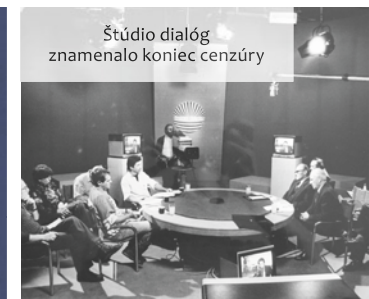
Štúdio dialóg znamenalo koniec cenzúry