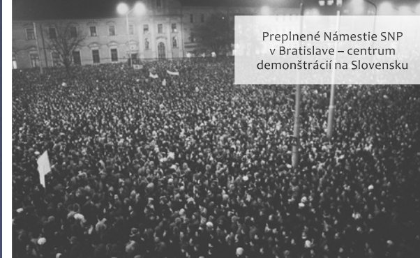
Preplnené Námestie SNP v Bratislave – centrum demonštrácií na Slovensku