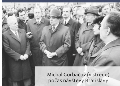
Michal Gorbačov (v strede) počas návštevy Bratislavy