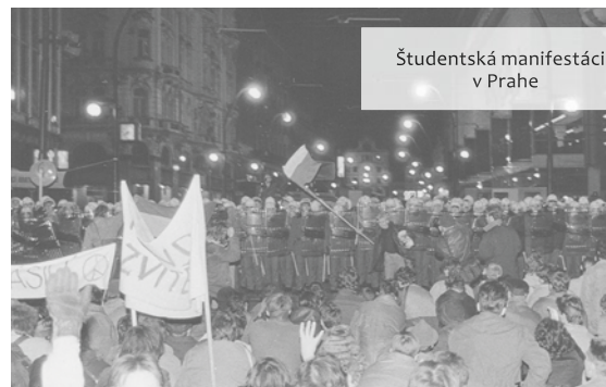
Študentská manifestácia v Prahe