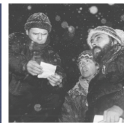
Vedúce osobnosti VPN na novembrovej tribúne: Milan Kňažko, Ján Budaj a Ladislav Snopko