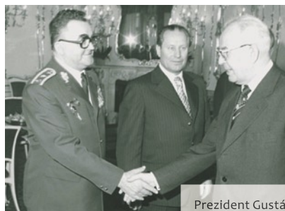
Prezident Gustáv Husák (vpravo) bol symbolom normalizácie