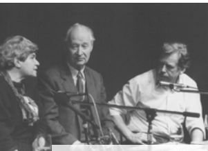
Alexander Dubček a Václav Havel počas revolučných dní