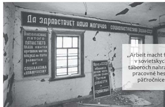
„Arbeit macht frei“ v sovietskych táboroch nahradili pracovné heslá päťročnice