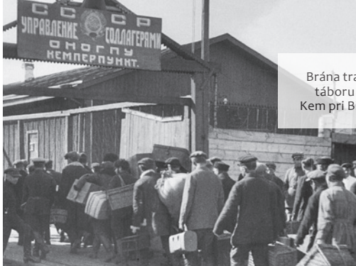
Brána tranzitného táboru v meste Kem pri Bielom Mori