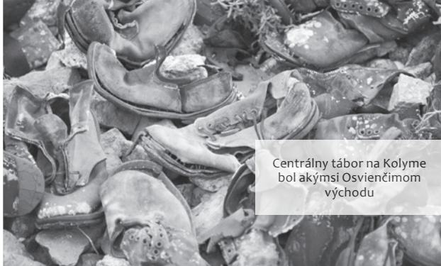
Centrálny tábor na Kolyme bol akýmsi Osviečením východu

„Práce sa zastavujú ak teplomer klesne pod 50° mrazu, pravda, nie s ohľadom na ľudí, ale s ohľadom na to máličko strojovej mechanizácie. Železo viac nevydrží, praská, láme sa.“