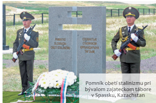
Pomník obetí stalinizmu pri bývalom zajateckom tábore v Spassku, Kazachstan

Odvlečených zo Slovenska zaraďovali tak do trestaneckých pracovných táborov, ako aj do táborov pre vojnových zajat- cov.