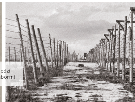
Ohradenie medzi jednotlivými táborami