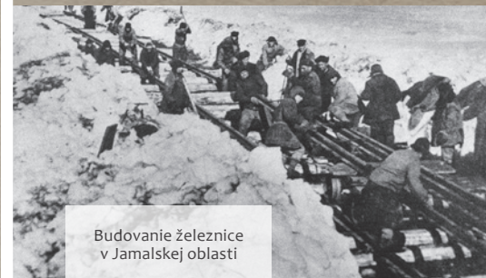
Budovanie železnice v Jamalskej oblasti