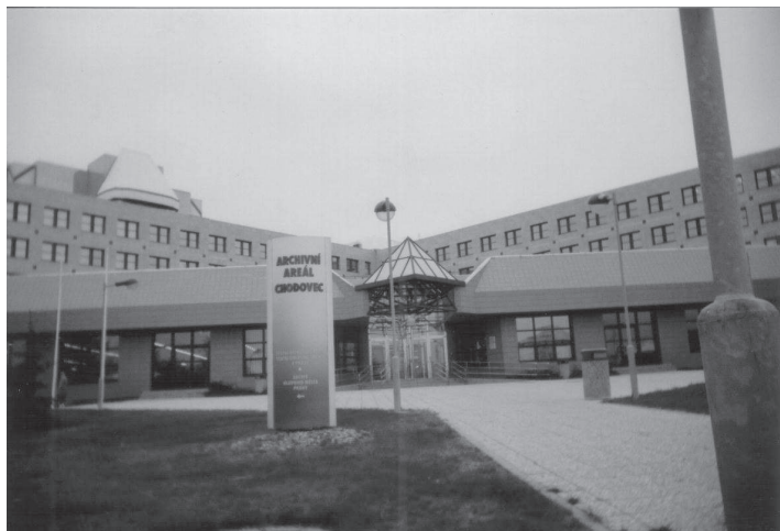
Areál Štátného ústředního archívu Praha-Chodovec.

oddělení mezinárodní politiky komunistické strany po roce 1962. Ani později, při projednávání návrhu v Senátu bohužel nebyl přijat návrh senátora Václava Jehličky, aby bylo povoleno z nezpracovaných archiválií pořizovat alespoň kopie. Archivy přitom nezavazuje ke zpracování žádná lhůta, takže je docela dobře možné, že řada nyní nezpracovaných archivních fondů v tomto stavu zůstane i třeba dalších padesát let. Zákonná norma nyní fakticky znemožňuje předložit ke zpřístupnění alespoň určitou archivně už zpracovanou část jinak nezpracovaného archivního fondu. Předkladatel návrhu Stanislav Gross (v t.č. ministr vnitra) při projednávání konstatoval, že je „připraven hledat metodu, (...) aby se nezpracovávaly třeba ze zákona fondy, po kterých žádná poptávka není, a aby se přednostně zpracovávaly fondy, po kterých poptávka je“. Není však známo, že by ministerstvo v tomto ohledu něco praktického podniklo.