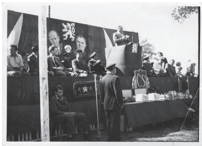
Vyobrazenie rôznych symbolov umiestnených na tribúne počas požiarnických pretekov v roku 1954.

Vincent Hložník je v skúmanom súbore zastúpený štyrmi kresbami ceruzou. Jednotlivé návrhy sú len čiernobiele. Všetky štyri návrhy vychádzajú z rovnakého zdroja. Ide o variácie na oválny emblém obrúbený rôzne lipovými ratolesťami a obilnými klasmi, v ktorého hornej časti sa vždy nachádza výrazná päťcípá hviezda. Predpokladáme, že rovnako ako v prípade návrhov J. Lörincza, mal byť novovytvorený symbol Slovenska umiestnený na hrudi českého leva. Ako alegóriu Slovenska si autor v dvoch prípadoch vybral trojvršie, raz vrch Kriváň a raz dva kopce, ktorých význam nie je úplne jasný, ale pravdepodobne v symbolickej rovine zobrazujú Kriváň a Říp.