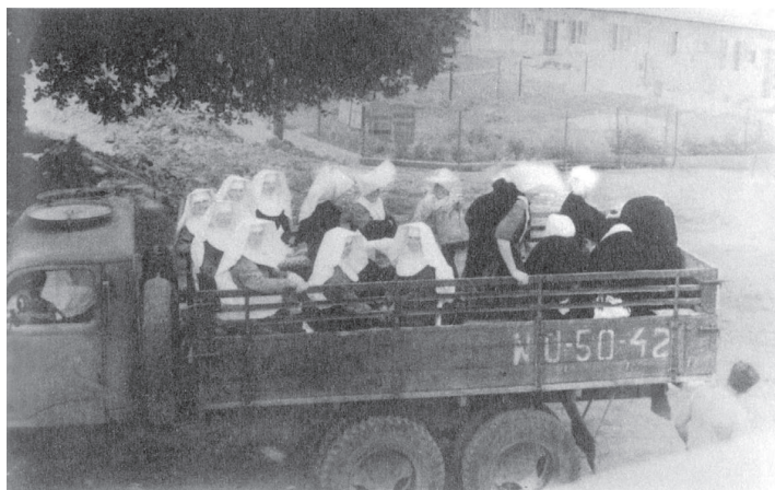
Františkánky v Kláštore pod Znievom pri odchode do práce na štátnom majetku v Diviakov (rok 1961).

Spomienky mnohých sestier a kroniky rehoľí a kongregácií sú výrečným svedectvom tejto barskej tragédie pre rehole, pacientov nemocníc, v ktorých sestry slúžili, pre personál, pre deti v ústavoch, pre starých a chorých a celkove pre kultúru a duchovnosť krajiny. Vykorenenie rehoľníčok z miest, kde desaťročia pôsobili a kde založili užitočné duchovné a sociálne tradície a diela je dodnes veľkou obžalobou primitívneho totalitného a ateistického režimu v ČSR po februári 1948.