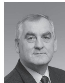
MVDr. Jiří Liška (1949) místopředseda Senátu Parlamentu České republiky (ODS).