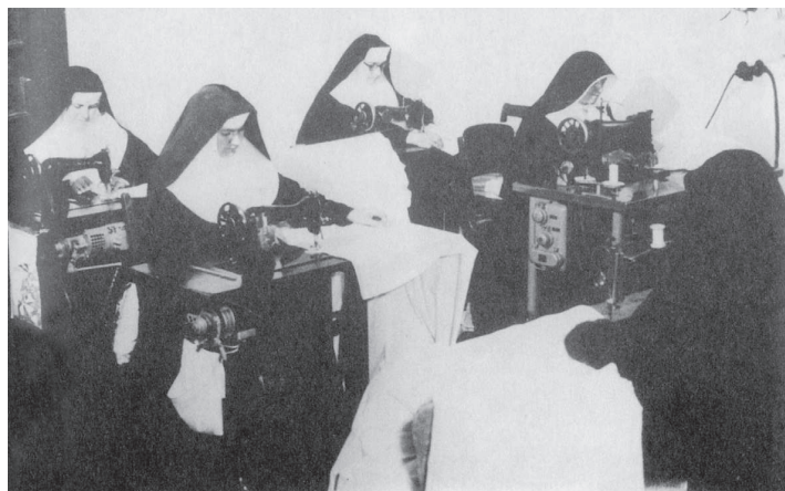
Uršulínky zo Slovenska v továrni v Broumave v roku 1961.